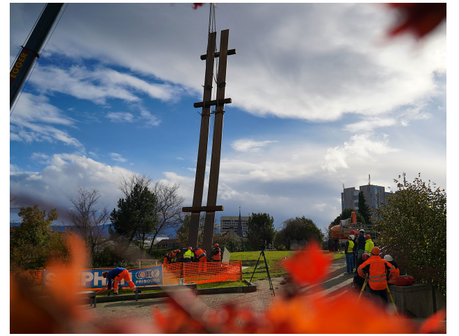
Un camion-grue et une nacelle ont été nécessaires pour réinstaller la sculpture devant l'Université Miséricorde. Christian Doninelli

Dominique Freymond décrypte les défis des entreprises familiales en matière de gouvernance